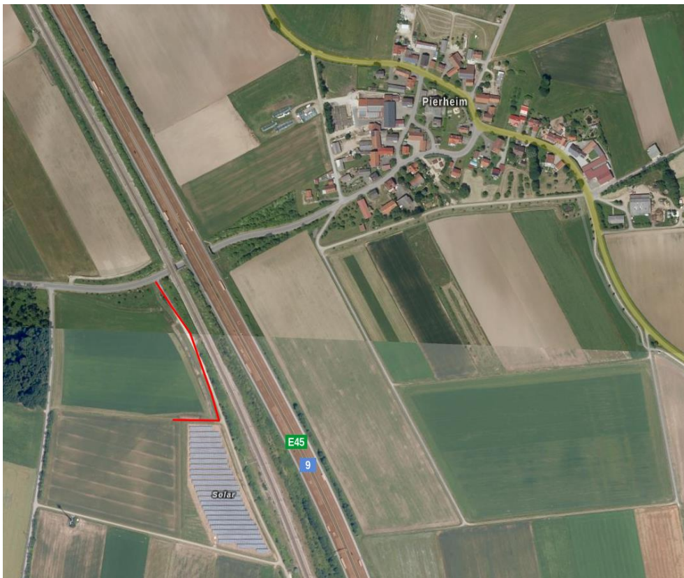
Zufahrt zum geplanten Sondergebiet

Die Erschließung des geplanten Solarparks erfolgt über die Gemeindeverbindungsstraße Grauwinkel- Pierheim von dort über den befestigten Flurbereinigungsweg nach Süden zum Geltungsbereich (siehe folgende Abbildung).