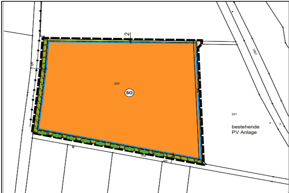
Abbildung 1: Umgrenzung der geplanten PV-Anlage südwestlich von Pierheim