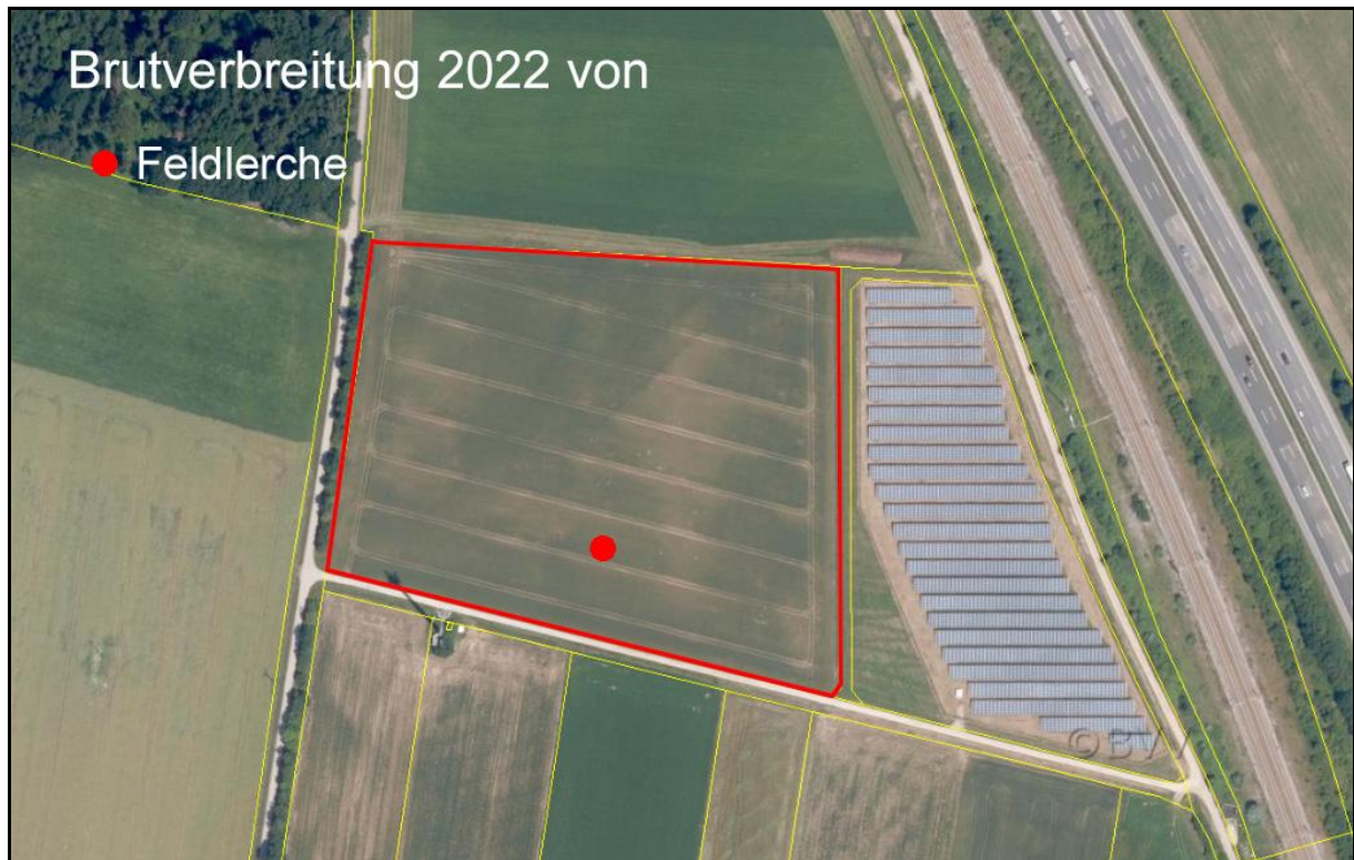
Abbildung 2: Brutverbreitung der Feldlerche im Bereich der geplanten PV-Anlage Pierheim-Südwest

Beeinträchtigungen sind somit für ein Brutpaar der Feldlerche gegeben. Für dieses Paar sind entsprechende Vermeidungs- und Minimierungsmaßnahmen zu ergreifen, da die lokale Population nicht gesichert ist.