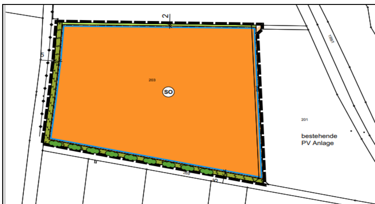
Abbildung 1: Umgrenzung der geplanten PV-Anlage südwestlich von Pierheim

Auf einer landwirtschaftlich intensiv genutzten Offenlandfläche südwestlich von Pierheim (Lkr. Roth) ist der Bau einer Freiflächen-PV-Anlage geplant. Auf der intensiv genutzten Ackerfläche wurde im Jahr 2022 Getreide angebaut. Der Geltungsbereich liegt östlich der Stadt Hilpoltstein (Landkreis Roth, Regierungsbezirk Mittelfranken). Dieser umfasst insgesamt 3,53 ha und beinhaltet die Flurnummer 203 in der Gemarkung Pierheim. Am westlichen Rand der Flurnummer, entlang der Straße erstreckt sich eine Hecke, im östlichen Anschluss liegt eine bereits bestehende PV-Anlage. Nördlich grenzt ein weiterer Acker an, südlich findet sich ein Feldweg.